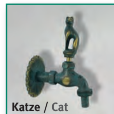
Katze / Cat