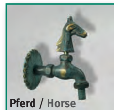
Pferd / Horse

with massive wall rose and hose connector, 1/2", with centering star, 4-colour-box