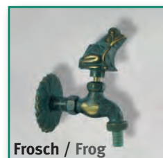
Frosch / Frog