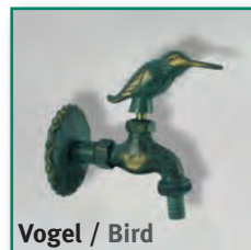
Vogel / Bird