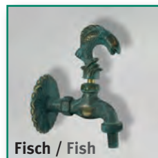
Fisch / Fish