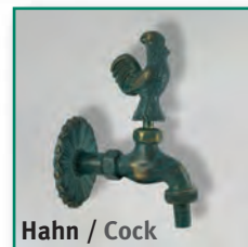
Hahn / Cock