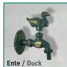
Ente / Duck